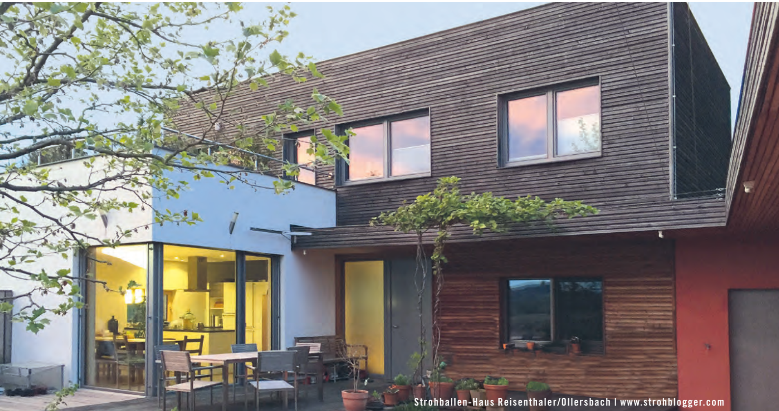
Strohballen-Haus Reienthaler/Ollersbach | www.strohblogger.com